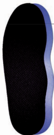
ST1150 MEMORY ●