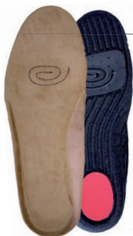
ST1035 DYNATEC PLUS ●